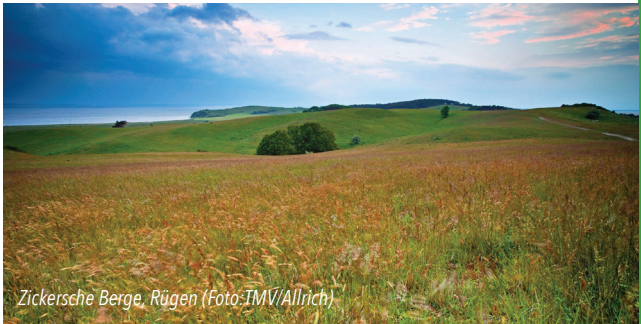
Zickersche Berge, Rügen

Anmeldung bis 10.07. unter 03832 68 31 59 oder ruediger.stromeyer@t-online.de