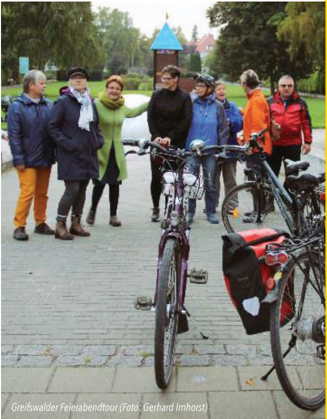
Greifswalder Feierabendtour