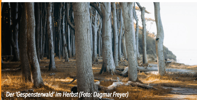
Der 'Gespensterwald' im Herbst