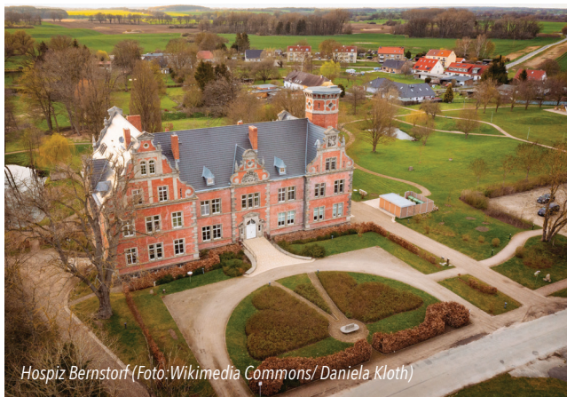
Hospiz Bernstorf