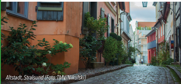
Altstadt, Stralsund

Bitte kurzfristige Änderungen unter www.stralsund-ruegen.adfc.de beachten.