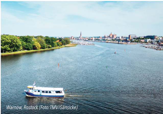
Warnow, Rostock

Anmeldung bis 16.06. unter martin.elshoff@adfc-mv.de oder 0171 7517157