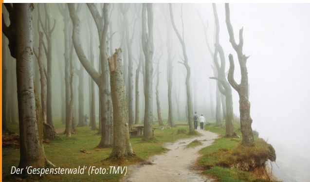
Der 'Gespensterwald'

Anmeldung bis 14.03. unter leolandregen@gmail.com