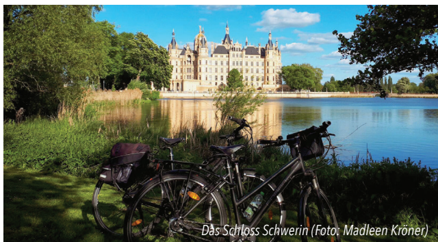
Das Schloss Schwerin