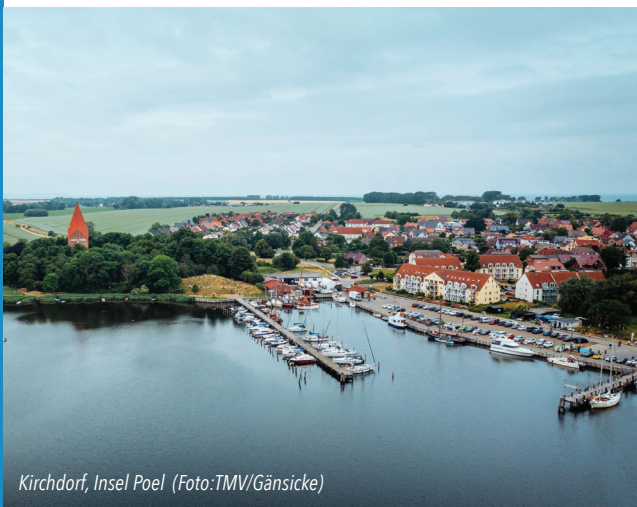
Kirchdorf, Insel Poel