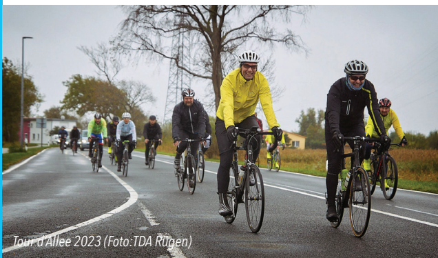
Tour d'Allée 2023

Anmeldung bis 08.10. unter 0171 131 506 74 oder renemartin@t-online.de