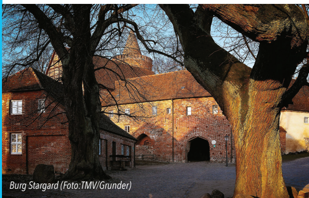
Burg Stargard

Anmeldung bis 14.01. unter 0171 131 506 74 oder renemartin@t-online.de