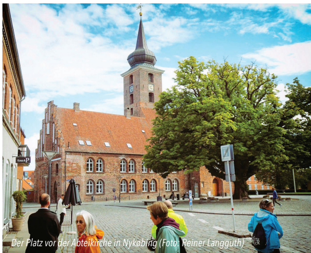
Der Platz vor der Abteikirche in Nykøbing

Anmeldung bis 25.06. unter chrisch9988@web.de