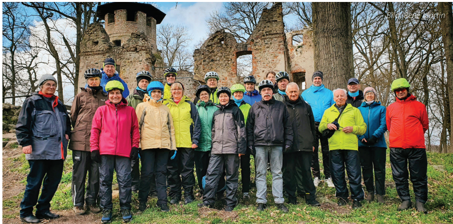
Regionalgruppe Tollense auf Tor vor der Burgruine Landskron

Die Fahrt in den Frühling war am 10.03.2022 unser Saisonaufakt und 21 Radler nahmen teil. Wetterkapiolen, typisch April eben forderten uns den ganzen Tag heraus. Wir hatten ein Mega Ziel, die Burgruine Landskron. Auf dem Weg dahin erfreuten wir uns an der mäandrierenden Tollense bei Kessin. Traumhafter Ausblick. Leckerer Erbseneintopf mit Bockwurst tischte unser Wirt auf und anschließend startete unsere Führung in der Ruine.