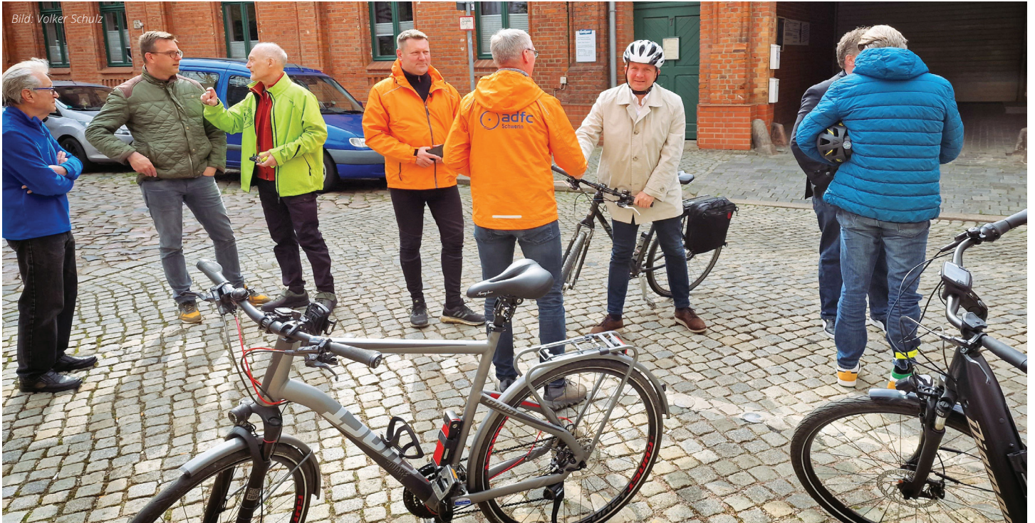
Auch der Oberbürgermeister (3. von rechts) war dabei

Manchmal ist es gut, wenn Stadtvertreter die Perspektive wechseln